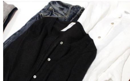
【ムモクテキ グッズアンドウェアーズ】

ポルトガルの自然な環境と、皮膚科医との共同開発によって生まれたオーガニック『固形石鹸』専門ブランド！