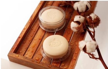
【エッセンシアス デポルトガル】

ファッションに情熱的な人のそれぞれのシーンに寄り添う、モード・ヴィンテージを軸としたオリジナルブランドが関西初出店！