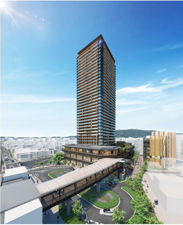
【駅方面からの眺め】