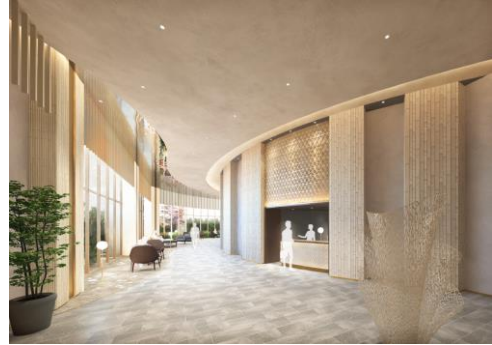
【高層タワーマンションエントランス完成イメージ】