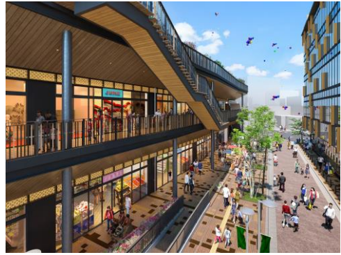
【シンボルロードからの眺め】