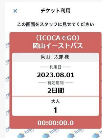
※画面は開発中のイメージです。

※16施設の中からチケット綴り10枚分を当日ご自由にお選びいただけます。 利用店舗により必要枚数が異なります。入館・体験で10枚(1冊)必要な施設もあります。