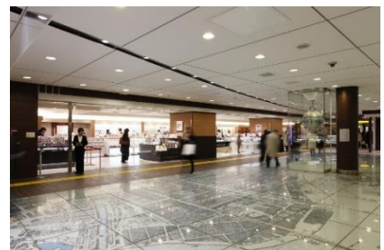
お土産・スイーツエリア