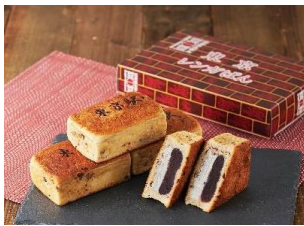
石川県初、東京駅限定 『東京レングパン』 東京あんぱん豆一豆