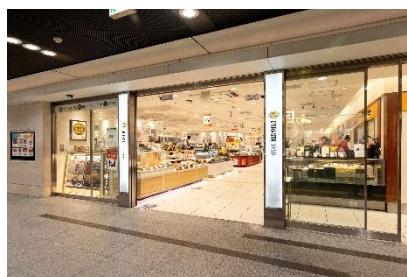
お弁当・惣菜エリア