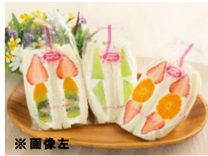
石川県初 『フルーツスペシャル(いちご)』 サンドイッチハウス メルヘン