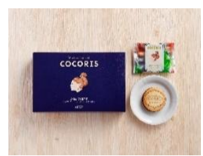
石川県初、東京駅限定 『サンドクッキー ヘーゼルナッツと木苺』 COCORIS