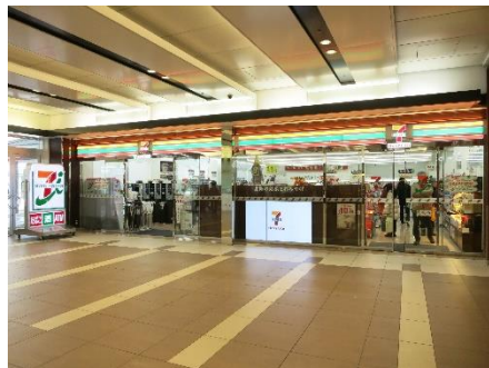
セブン-イレブン ハートイン JR 金沢駅店