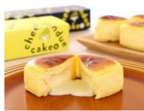
石川県初 『チーズフォンデュケーキ』 テラ・セゾン