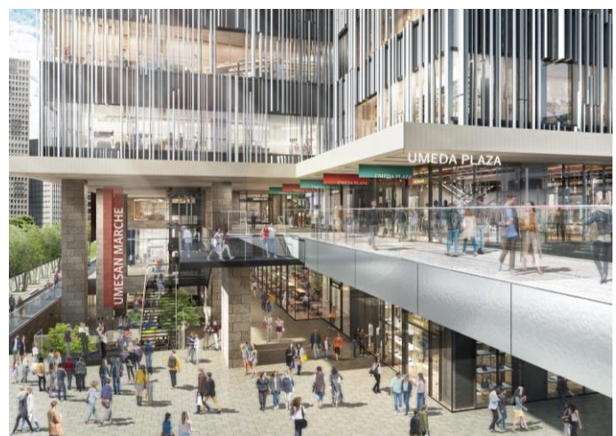
南東広場イメージ (JR大阪駅南側から)