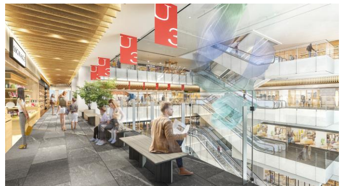
アトリウムイメージ (商業フロアから)

好奇心を刺激するさまざまな体験と出会いを提供し、ぜひ行きたくなる、そんな場所を目指します。