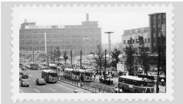
コンセプト動画キャプチャ①

特設サイト URL : https://jptower-kitte-osaka.jp/ ※コンセプト動画は特設サイト内にて公開します。