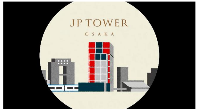
コンセプト動画キャプチャ②