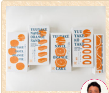
広島県福山市 瀬戸内果実研究所 Produce by Ben-Kyou-dou