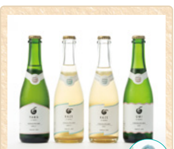
山口県山口市 やまぐちシードル