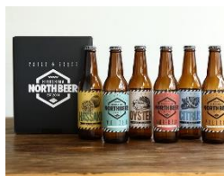
広島北ビール (広島市) クラフトビール