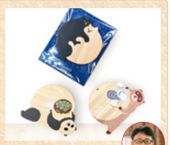
広島県広島市 天王