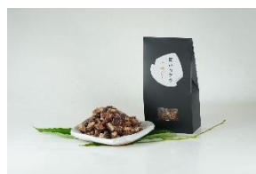
和栗のスイーツがんね栗の里 (岩国市) 栗の渋皮煮 栗のカケラ