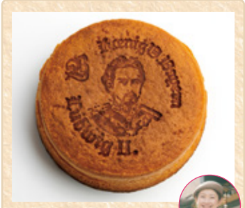
広島県広島市 西洋菓子処バイエルン