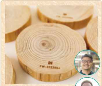
広島県庄原市 HIBA RINGs 舛元木工 × FOREST WORKER