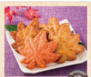
広島県広島市 坂井屋