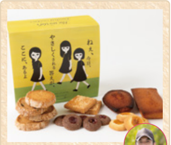
広島県東広島市八本松 パティスリーソンヌフ