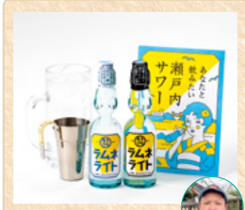
広島県呉市 中元本店