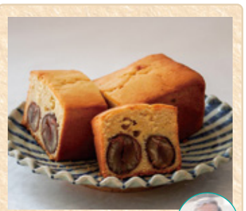
山口県岩国市美和町 がんね栗の里