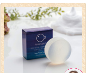
山口県周南市 Fleur Parler ~フルール パルレ~