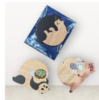
天王 (広島市) 木製コースター

3. 来場者限定！JR西日本公式オンラインショップ「DISCOVER WEST mall」でご利用いただけるクーポン配布 会場で商品をお買い上げのお客様に、「DISCOVER WEST mall」でご利用いただける500円クーポンを配布します。詳しいご利用方法は、クーポン案内用紙をご覧ください。