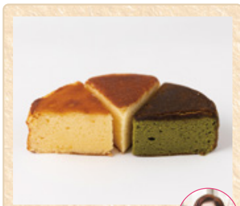
広島県広島市 福々庵