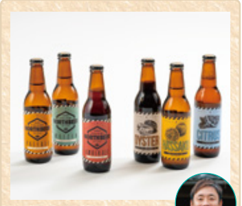
広島県広島市 広島北ビール