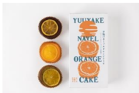
勉強堂 (福山市) 夕焼けネーブルオレンジケーキ