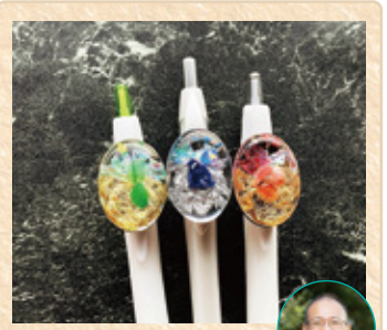
広島県呉市焼山 山陽機創