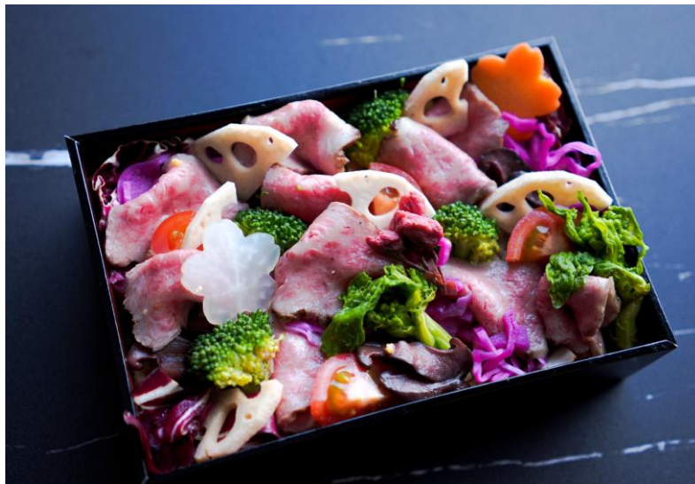
特製弁当イメージ