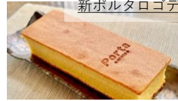
Porta焼き印入りカステラ (京菓匠鶴屋長正)