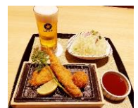
ほっと一息ほろ酔いセット 1,390円（とんかつKYK）