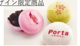
あずきの花 (3個入) (井筒ハッ橋本舗)