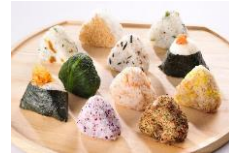
えんの手作りおにぎり3個セット 390円（だし茶漬けえん）