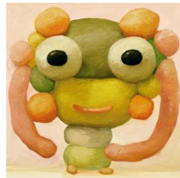
AKIKO(キャンバスに油彩、55x55cm、2022年価格：418,000円(税込み))

【日時】2023年3月3日(金)～12日(日) / 【場所】ルクア イーレ4F イベントスペース「sPACE」