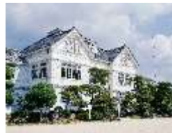
旧遷喬尋常小学校