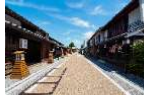
城東町並み保存地区