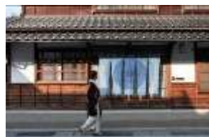
勝山町並み保存地区