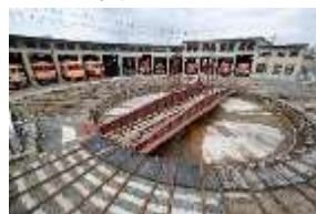
津山まなびの鉄道館