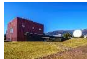
奈義町現代美術館