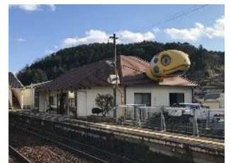
亀甲駅(美咲町) インパクトのある大きな亀の駅舎がお出迎え