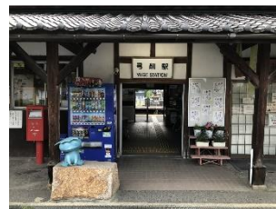
弓削駅(久米南町) 県内最古級の木造駅舎と川柳がお出迎え