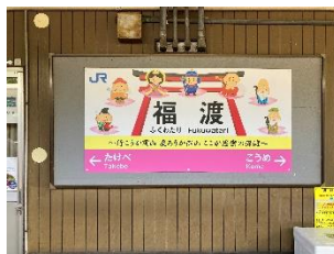
福渡駅(岡山市) 縁起のよさそうな七福神の駅名看板がお出迎え