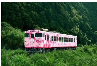
淡いピンク色の車体に沿線の四季折々の花びらをイメージした外装デザイン