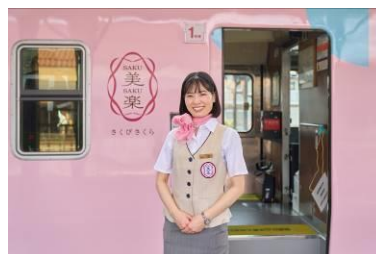
車内アテンダントが沿線の案内や車内販売などお客様の旅をサポート