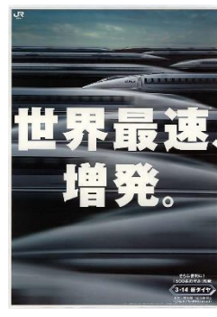
▲ ポスター「世界最速増発。」(1998年)