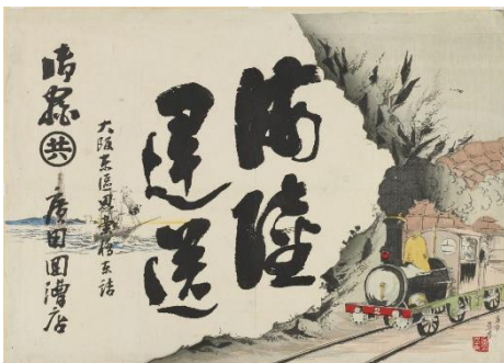
▲ 引札「海陸運送」明治期