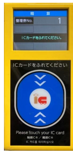
<降車時のICカードリーダー>