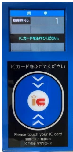
<乗車時のICカードリーダー>

乗車時及び降車時に、バス乗車口付近及び降車口付近に設置しているICカードリーダーに「IC O C C A」をタッチすることで、利用できます。