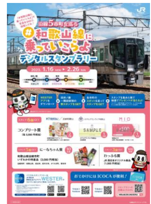
※ポスターイメージ