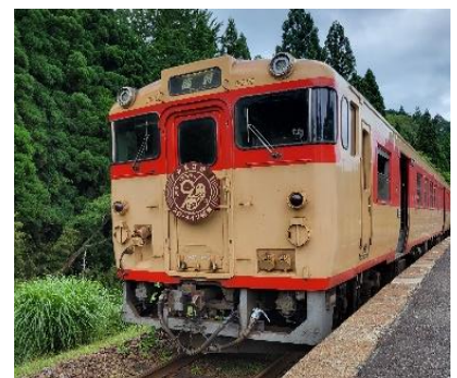
2022年7月に運転した みまさかスローライフ列車