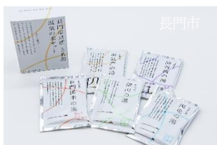
長門五名湯 温泉の素セット