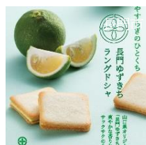
長門ゆずきちラングドシャ