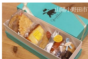
グランシャリオ焼き菓子セット

・ご乗車いただいた方にはもれなく、山陽小野田市・長門市・美祿市の人気の名産品をプレゼントします。