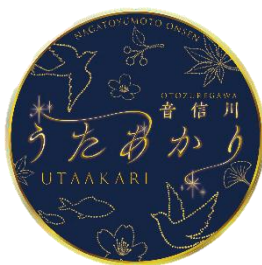
オリジナルヘッドマーク

・通常山陰線を運転する観光列車「〇〇のはなし」車両を、特別に山陽線～美祿線～仙崎線にて貸切運行します。また、列車にはうたあかりイベントをモチーフにしたオリジナルヘッドマークを掲出します。