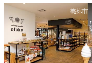
道の駅おふく お買い物クーポン（1,500円分）