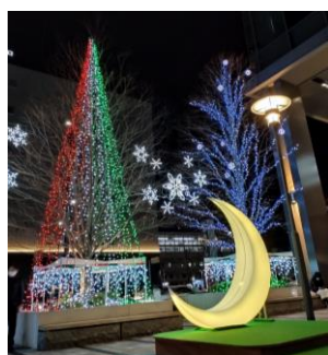
▲エキキタ・ドリミネーション