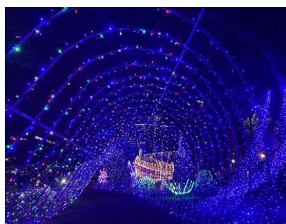
▲ひろしまドリミネーション