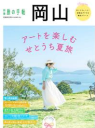
交通新聞社 「別冊旅の手帖 岡山」