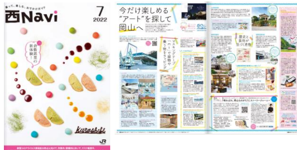
JR 西日本のおでかけ情報紙「西 Navi」6~9 月号