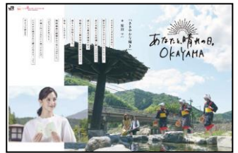
JR グループによる駅ポスター・駅デジタルサイネージ・中吊りポスター等