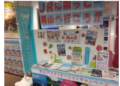
旅行会社店舗での販促活動 (PR コーナー・イベント開催 等)