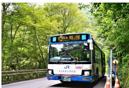
西日本 JR バス