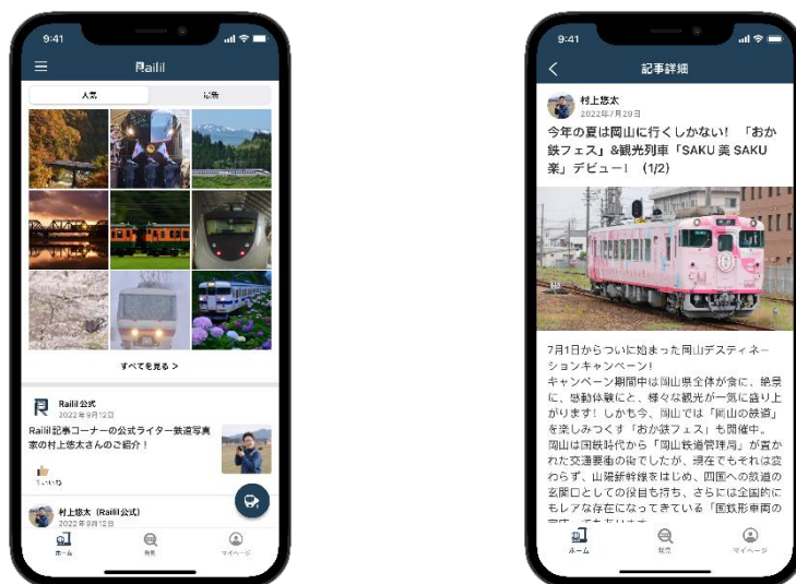
アプリの画面イメージ(左/ホームタブ、右/鉄道コラム)