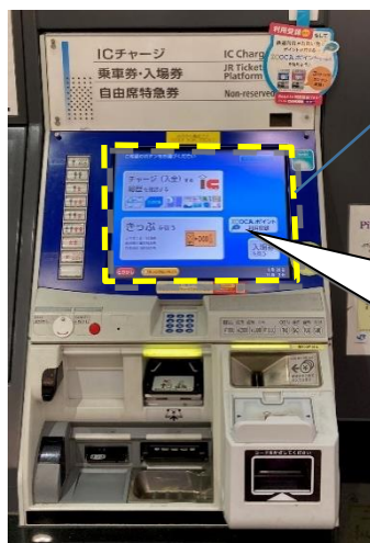
近距離型自動券売機

従来の「近距離型自動券売機」のディスプレイ部分をタッチレスパネルとすることにより、画面に直接触れることなく、券売機操作・きっぷの購入ができるようになります。 ※本実証実験は「株式会社 JR 西日本テクシア」の協力のもと実施いたします。