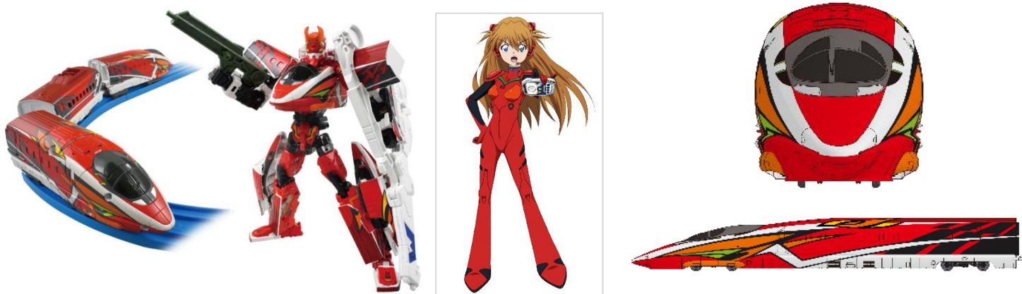
プラレール「新幹線変形ロボ シンカリオンZ シンカリオンZ 500 TYPE EVA-02」とアスカの運転士ビジュアル 「500 TYPE EVA-02」ラッピングの500系新幹線電車 (イメージ)

株式会社タカトミーから、2022年12月10日(土)より、テレビアニメ『新幹線変形ロボ シンカリオンZ』の新品 プラレール「新幹線変形ロボ シンカリオンZ シンカリオンZ 500 TYPE EVA-02」 (希望小売価格：7,480円/税込) が発売されます。これを記念し、京都鉄道博物館では、2022年10月28日(金)から「500 TYPE EVA-02」仕様にラッピングした500系新幹線電車が期間限定で登場！実物の500系新幹線電車(全長約27m)が、「500 TYPE EVA-02」仕様にラッピングされた迫力ある姿は、鉄道ファンのみならず、『エヴァンゲリオン』シリーズのファンの皆様にもお楽しみいただけます。