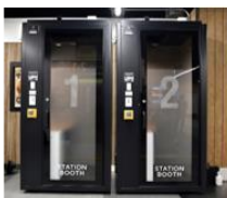
▲ STATION BOOTH