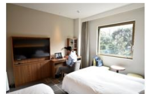
▲ ホテルメッツ目白