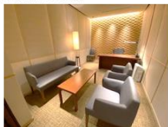
▲ STATION DESK東京premium