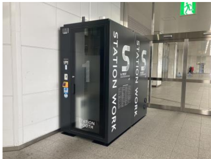
新神戸駅 新幹線改札外