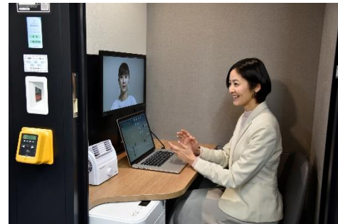
STATION BOOTH ご利用の様子