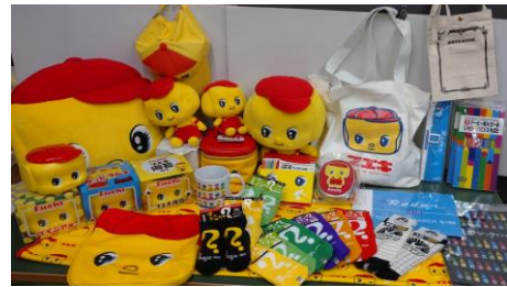
〔フェキくんアイテム〕