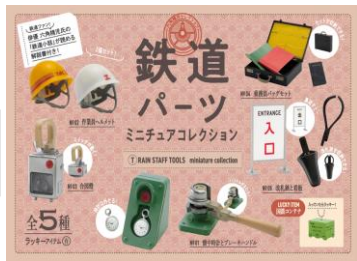
〔鉄道パーツ・ミニチュアコレクション〕