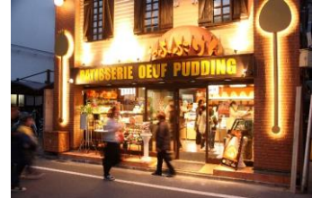
〔うっふぷりん・茨木本店〕