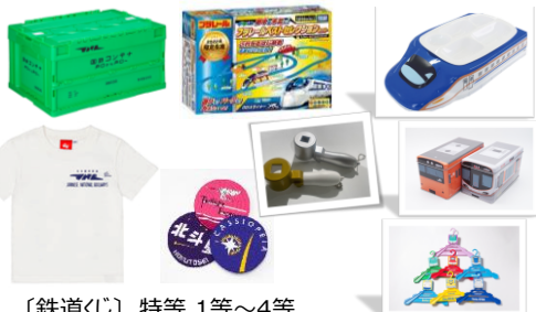
〔鉄道くじ〕 特等,1等～4等 ハズレくじなし

【フェキマルシェ】10月18日(火)～11月3日(木) キュートな容器でおなじみの「フェキどうぶつ」のフェキくん。ステーションナリーやコスメグッズとのコラボで話題になった商品のポップアップストアです。バラエティ豊かなフェキくんアイテムをご用意して、お客様のお越しをお待ちしております！