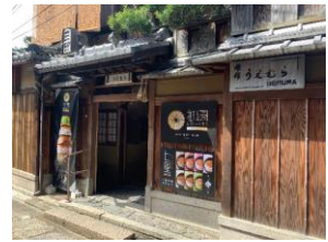
〔京都老舗旅館・うえむら〕