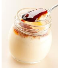
〔元祖・うっふぷりん〕

「うっふぷりん」の「うっふ」とはフランス語の「タマゴ」oeuf(ウフ)から由来しています。割ってみなければ中味がわからない玉子のように、召し上がって頂ければ美味しさとこだわりが伝わることと思います。お菓子の原点であります玉子のように基本を忠実に手作り的美味しいぷりんを通じ、お客様の笑顔へのお手伝いできれば幸いです。