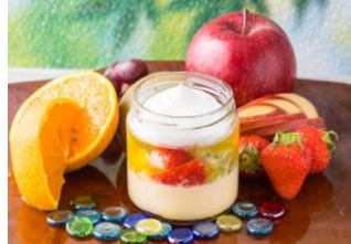
〔うっふぷりんア・ラ・モード〕