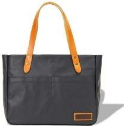
豊岡鞆「横型トート天ファスナー」