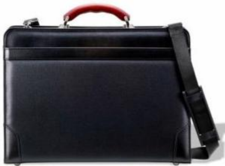
豊岡鞆「木手大割れダレス」

■景 品②：5 カテゴリのスタンプを獲得⇒豊岡鞆3点を抽選でそれぞれ1名様にプレゼント