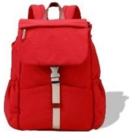
豊岡鞆「マザーズリュック」