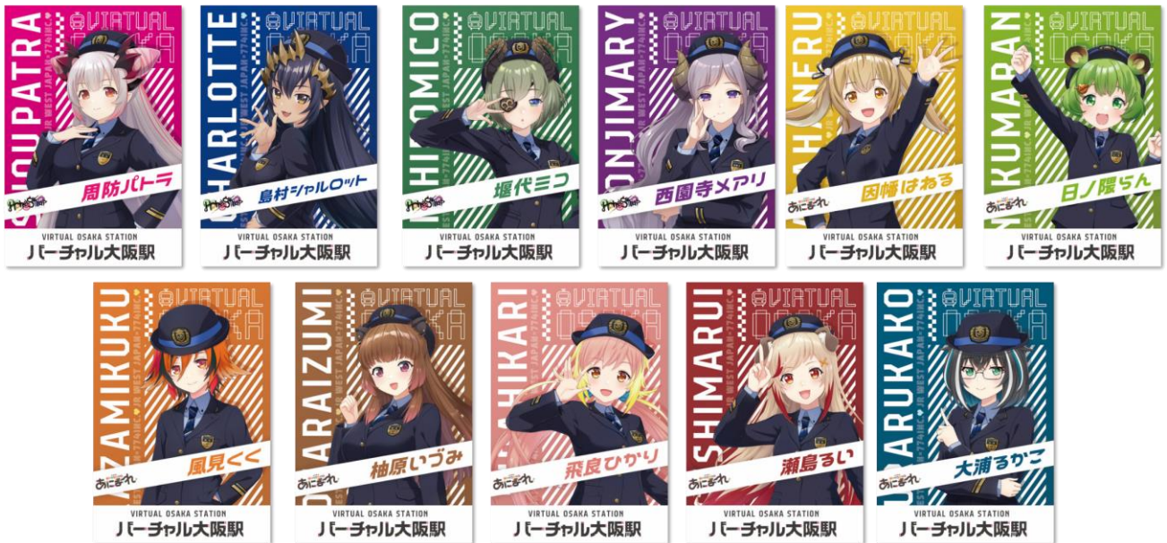
＜配布チラシ・ポストカード(全 11 種類)のイメージ＞