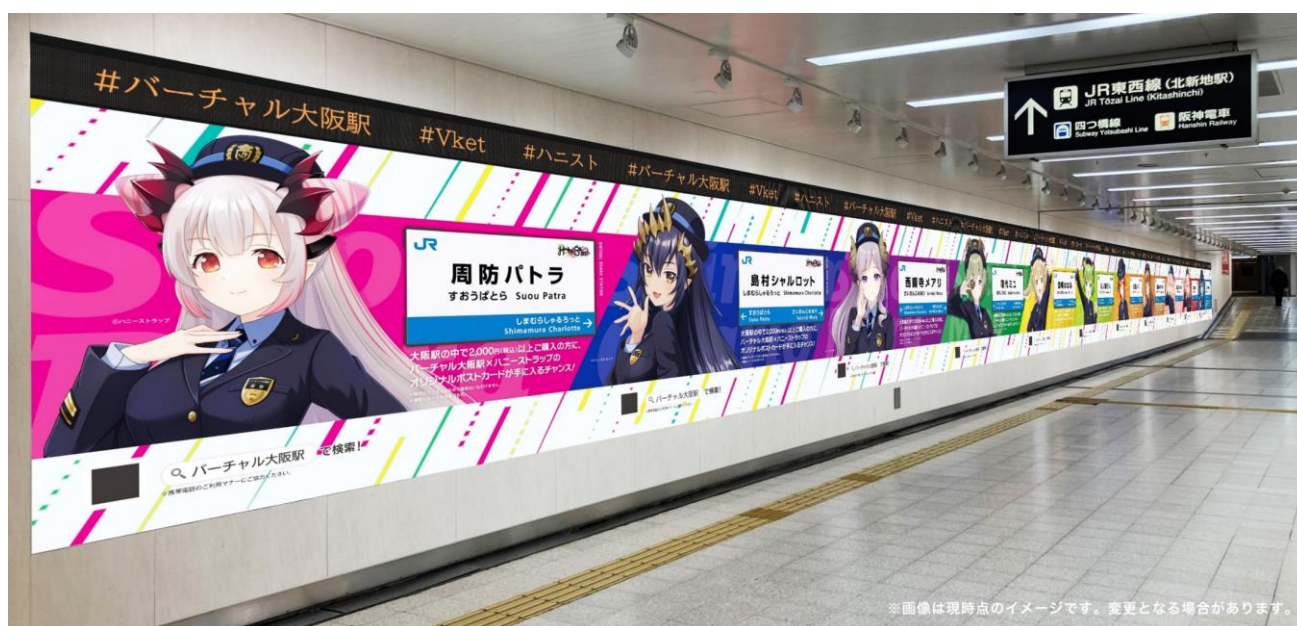
<交通広告掲出イメージ(大阪駅桜橋口地下通路)>

また、バーチャル大阪駅を盛り上げるため、人気VTuberグループ「有閑喫茶あにまーれ」と「HoneyStrap(ハニーストラップ)」がリアル大阪駅をジャック！メンバーがJR西日本の制服を着たスペシャルな交通広告が8/15(月)～8/28(日)の期間限定で、大阪駅桜橋口の地下通路を埋め尽くします。