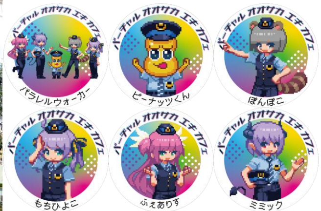
<コラボカフェ・オリジナルコースター(全6種類)イメージ>