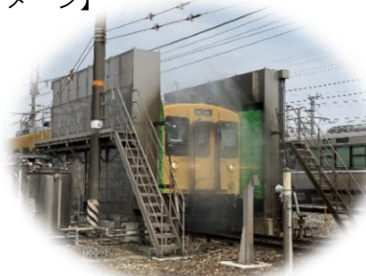
車両の機械洗浄体験