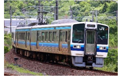
現在運行中の213系電車

岡山・備後エリアは、国鉄型の車両が今でも現役で運行する、全国でも希少なエリアです。こうした強みを活かして、かつて運行していた列車をイメージした団体臨時列車の運行を予定しています。この度、かつての使用車両を用いたリバイバル「マリンライナー」について運行概要と発売方法が決まりましたのでお知らせします。