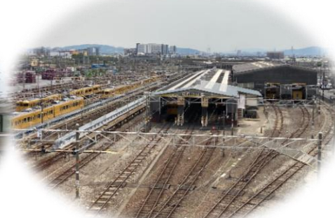
岡山電車区の様子