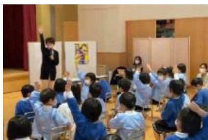
いじめ防止に関する学びの活動