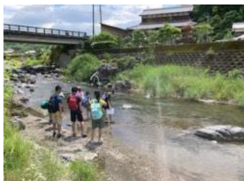
川遊びの事故防止フィールドワーク