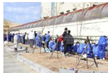
被災地区の復興イベント(倉敷市)

グリーンケアをはじめとした心のケアや災害時にお互いが支えあうために必要な地域コミュニティを重視した活動など、これまで様々な活動及び研究を応援してきました。