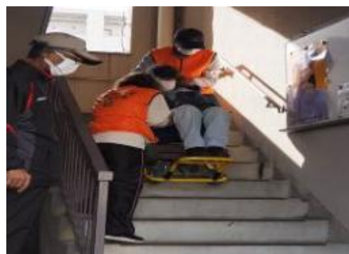
集合住宅における避難訓練