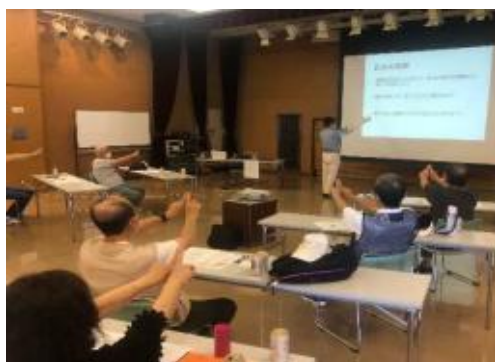
高齢者対象の安全に関するセミナー