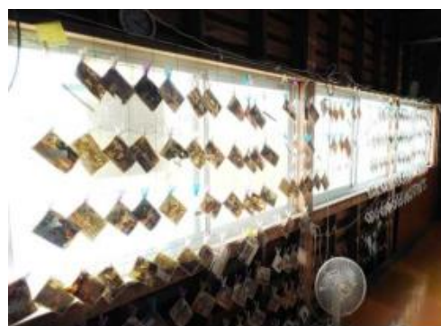
西日本豪雨被災地区の写真洗浄活動