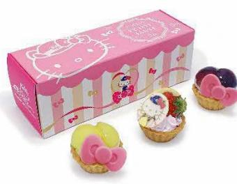
ハローキティ新幹線 「HELLO! SWEETS BOX」