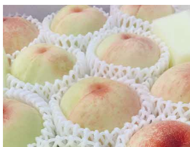
岡山県産 「岡山白桃」