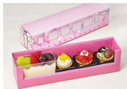
SAKU美SAKU楽 「岡山のスイーツセット」 ※清涼飲料水「岡山育ちの白桃」 とセットでの販売となります