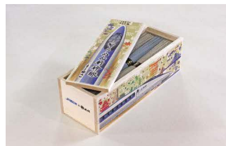
池利 (奈良県) そうめん新幹線【500系】

「いいもの探訪」で大人気の「そうめん新幹線」シリーズにJR西日本の「500系新幹線」が新登場。会場にて先行販売します。そうめん発祥の地と伝わる“三輪の里”の老舗「池利」が手掛ける500系新幹線をイメージした色そうめんは夏にぴったり。500系新幹線を精緻に描いた専用の木箱に入っています。