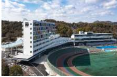
KEIRIN HOTEL 10 (岡山県玉野市)