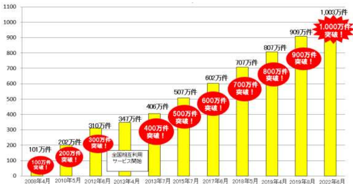
(万件) 【1日あたりの交通系電子マネーの最高ご利用件数の推移】