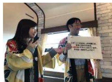
過去の車内おもてなしの様子

ご乗車の皆様に、萩を感じていただける、乗車記念のノベルティもプレゼントいたします。