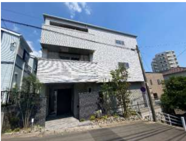
西面（エントランス）