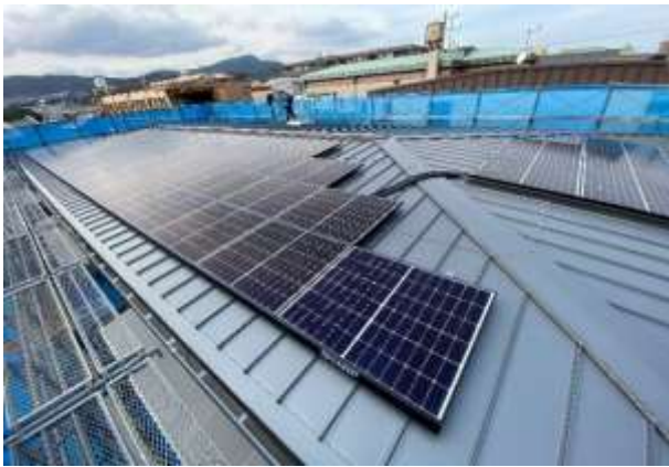
太陽光発電システム（施工時撮影）