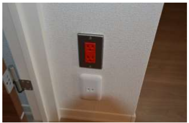
非常用コンセント