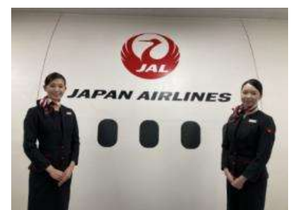
JAL ふるさと応援隊(イメージ)

旅の初日は、羽田空港から岡山へ飛び、倉敷美観地区の観光をお楽しみいただけます。お泊まりは世界的にもトップクラスのラドンの含有量を誇る三朝温泉。ゆっくりとおくつろぎください。翌日は「あめつち」にご乗車いただき、車窓からの大山や雄大な日本海など山陰ならではの美しい景色をご堪能ください。「あめつち」には JAL ふるさと応援隊として活躍する客室乗務員も同乗し、皆さまの旅を盛り上げます。また、出雲大社観光の案内役も務めますので JAL ならではの旅をお楽しみください。