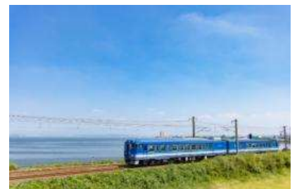
「あめつち」走行シーン(イメージ)

JR 西日本の観光列車「あめつち」は日本の原風景に出会える山陰本線を走ります。紺碧色の車体、そして神話のエッセンスが散りばめられた内装は、山陰の美しい風景とともに「古くて新しい日本」を演出します。このたびはJALとJR 西日本、ジャルパックの特別企画とし、「あめつち」を丸ごと貸切し、7月の連休に山陰・山陽エリアを巡る 2・3日間のツアーをご用意しました。