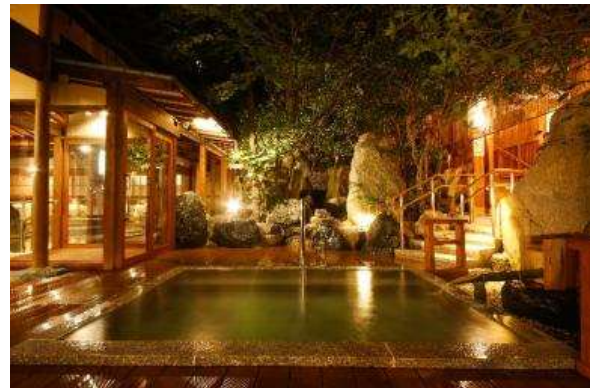
三朝温泉 依山楼岩崎 露天風呂(イメージ)

今後、3社の連携により山陰の魅力を積極的に発信することに加え、移動の利便性を向上させる取り組みをより推進することで、広く観光客を呼び込み、活気に溢れた地域づくりに貢献します。