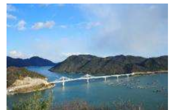
間近で見る 備前の日生大橋は圧巻！