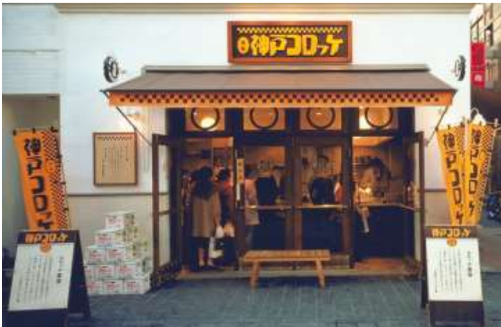
当時の「神戸コロッケ」元町店（1号店）

そこで、安心・安全で本当においしいコロッケが日本の食卓に必要ではないか、という強い思いから、その年の春、神戸コロッケが誕生いたしました。