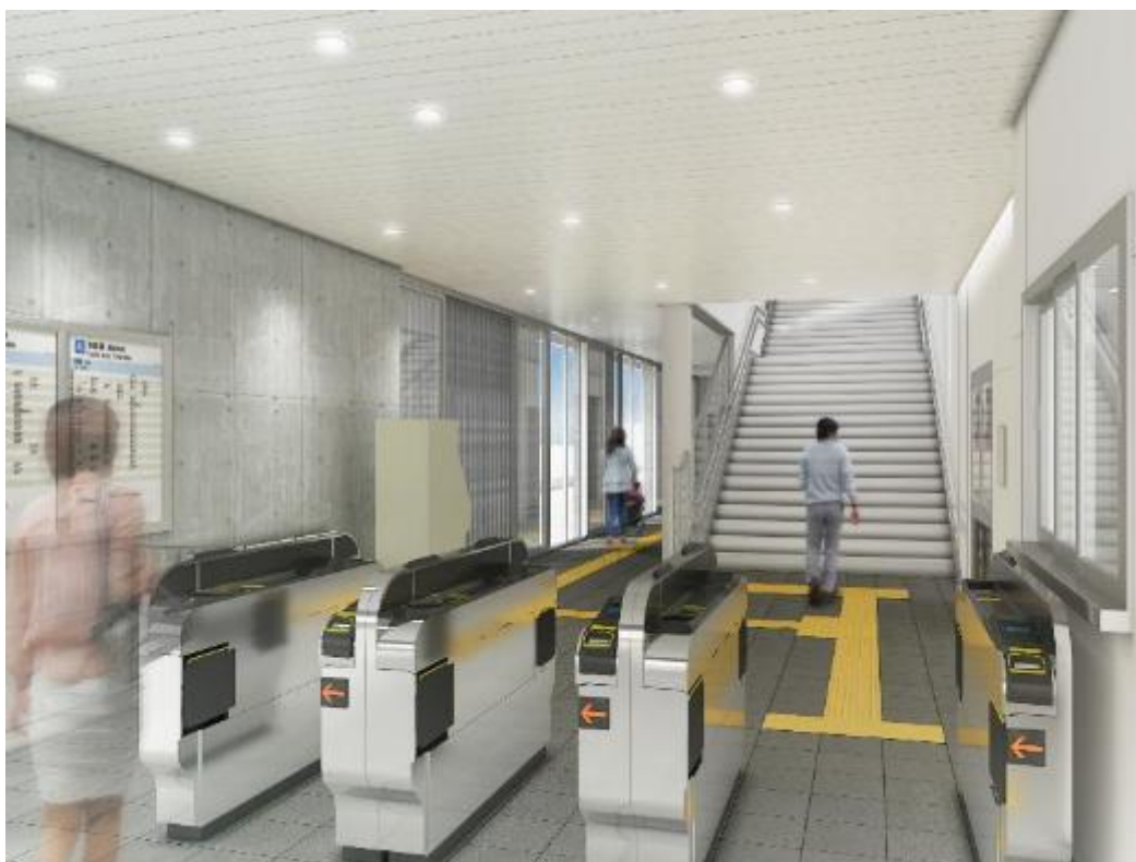
北側駅舎 内観イメージ