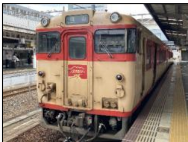
ノスタルジー車両（キハ47形2両）全席指定席