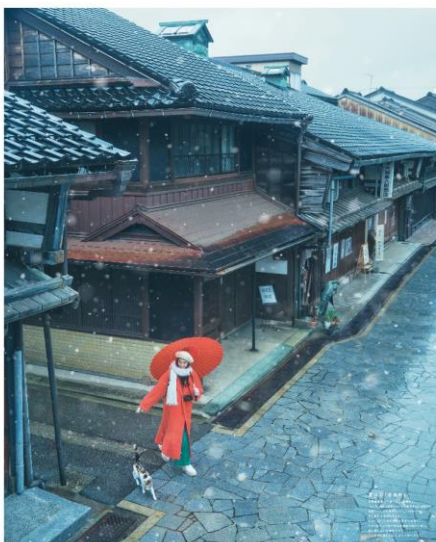
Japanese Beauty Hokuriku 2021.12.1 - 2022.3.31