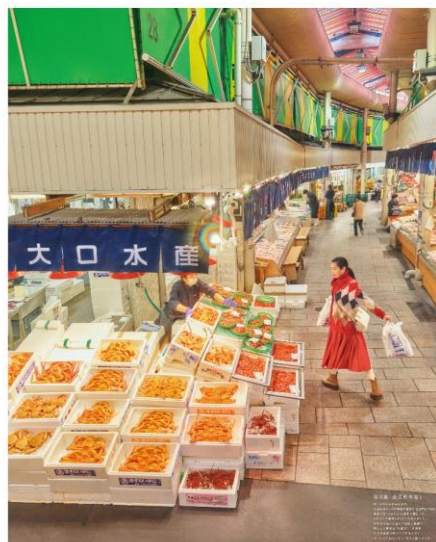
Japanese Beauty Hokuriku 2021.12.1 - 2022.3.31