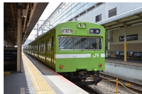
▲奈良線で活躍中の103系(京都駅)

※営業線を運転して搬入するため、輸送上の都合により展示を中止する場合があります。