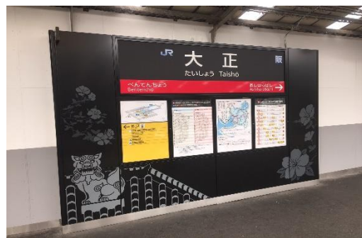
▲大阪環状線の全19駅にシンボルの花 定まる (例：大正駅 山つつじ)