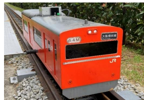
▲なんとこの模型は職員の手作り！