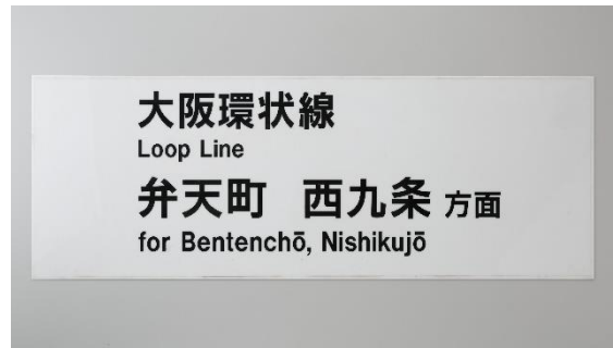
▲大阪環状線案内板 今宮駅用