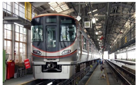
▲機能保全検査の様子