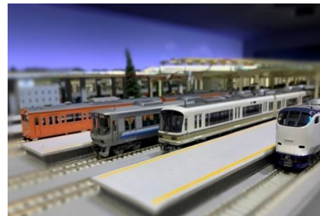
▲登場する模型列車たち(イメージ)