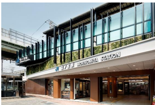
▲森ノ宮駅のリニューアル 2015(平成27)年5月29日リニューアル オープン