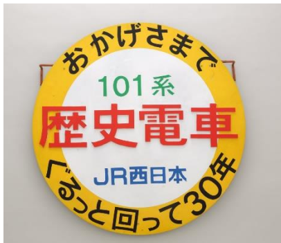
▲101系の30年記念 ヘッドマーク 1991(平成3)年

【紹介予定】大阪環状線で活躍した電車のヘッドマーク、各種パンフレット、323系完成時の除幕式の幕 また、今回の企画展に合わせて、特別に撮影した森ノ宮電車区での機能保全検査の様子や検修員へのインタビュー映像等も紹介します。