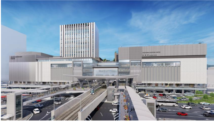
(参考)広島新駅ビル外観と7階屋上広場イメージ