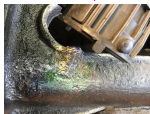
③ 【キズ】 長さ 65mm、深さ 5mm