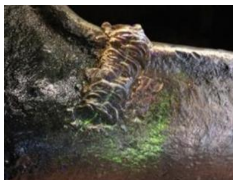
② 【キズ】 長さ 70mm、深さ 6mm