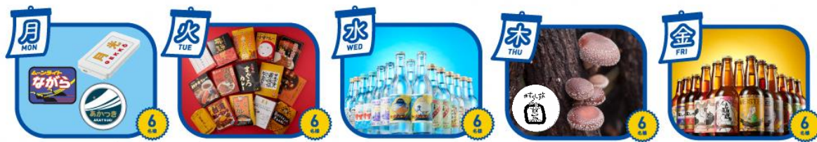
オリジナル鉄道グッズ 沿線のご当地 カレー30種 沿線のご当地 サイダー72本 原木しいたけ 栽培キット 沿線のご当地 ビール30本

現在、複数人でおトクな「EXのぞみファミリー早特」が「平日」にもご利用いただけます。ぜひこちらの商品も利用してキャンペーンへご参加ください。