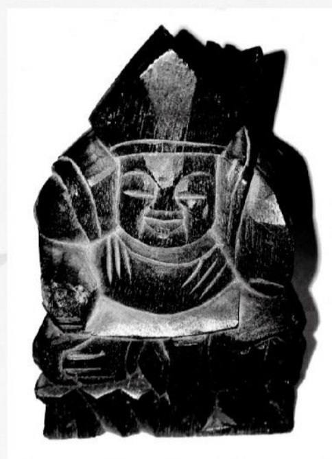
蛭子(えびす)像(大鳥居古木)

開館時間 9:00～17:00(入館は16:30) 休館日 月曜日(祝日・振り替え休日の場合は翌日) 入館料 一般 300円 高校生 170円 小・中学生以下 無料 65歳以上150円(年齢のわかるもの(免許証等)を提示してください。) 障害者手帳をお持ちの方は無料(手帳のご提示が必要です)