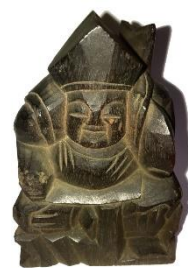
えびす 蛭子像(大鳥居古木)