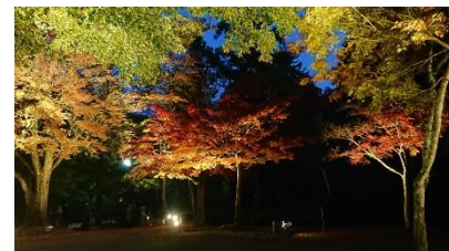
ライトアップイメージ