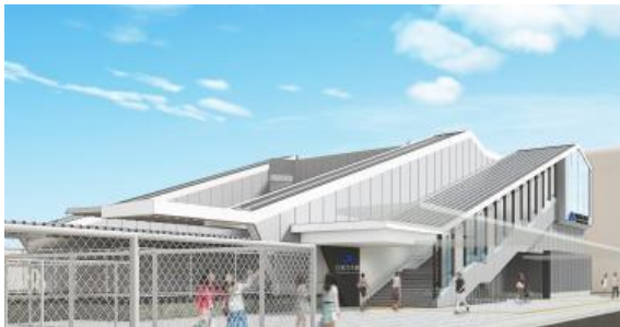
橋上駅・自由通路外観イメージ（東側）