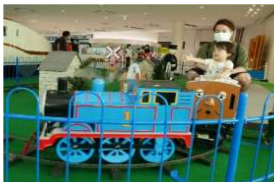
▲レッツゴートーマス