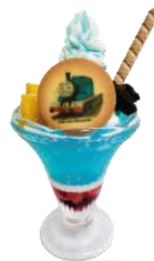
▲きかんしゃトーマスパフェ 830円(税込)