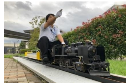
▲実物の1/8サイズのSLが走行！