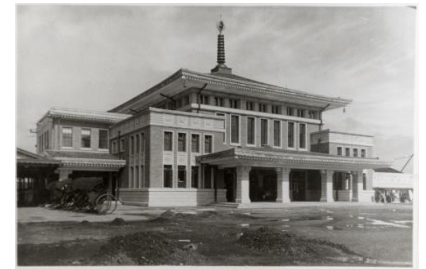
▲2代目奈良駅(昭和8年頃)