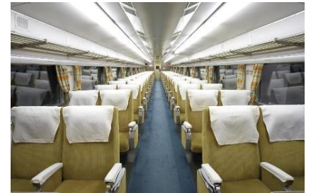
▲0系新幹線電車16形1号車