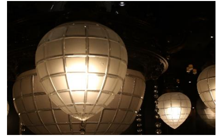
▲2代目京都駅貴賓室の シャンデリア(昭和20年代)