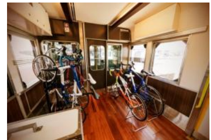
サイクルスペース(車内)