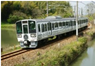
La Malle de Bois 外観

また、10月・11月限定で、「ラ・マル しまなみ」は三原駅まで延長運転を行います。「SEA SPICA(シースピカ)」と乗り継ぎ、せとうちエリアを1日で周遊できる運行ダイヤとなっています。