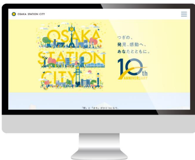
パソコン画面イメージ

■ 10周年特設WEBサイトURL : https://osakastationcity.com/10th