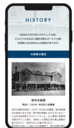
大阪駅の歴史紹介 スマートフォン画面イメージ