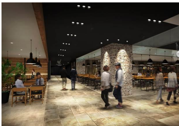
2階共用通路（各店舗内装には異なる部分があります）